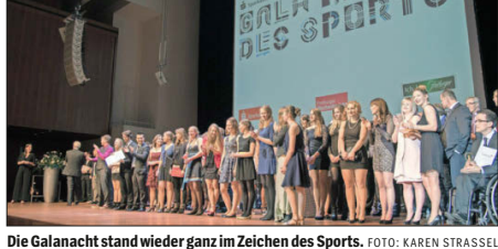
Die Galanacht stand wieder ganz im Zeichen des Sports.